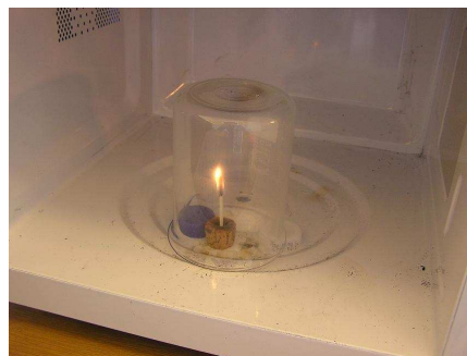
Figur 2: Tændstikken tændes og glasset sættes over.

placeres midt i mikrobølgeovnen og tændstikken antændes, se figur 2, og mikrobølgeovnen kan nu tændes og eksperimentet begyndes.