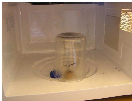
Figur 4: Når mikrobølgeovnen stopper forsvinder plasmaskyen og efterlader bl.a. giftige gasser.