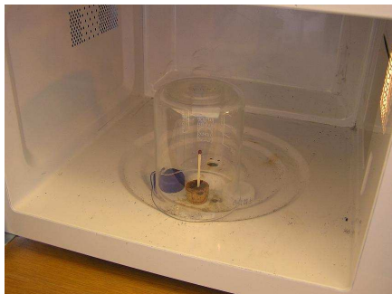
Figur 1: Tændstikken stikkes i korkproppen, der der placeres under et glas, der står på nogle "fødder", her plastikskruelåg.

Tændstikken stikkes ned i korkproppen eller igennem toppen af et bukket stykke karton så den står lodret op. Korkproppen placeres mellem nogle plastiklåg, således at glasset kan stå med bunden i vejret ovenpå disse, sådan at der stadig kan komme luft ind til tændstikken, se figur 1. Hele anordningen