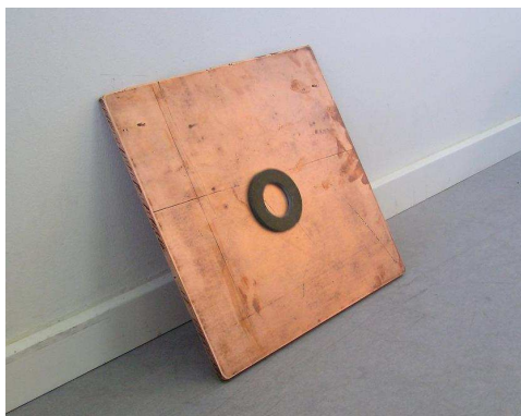
Figur 1: Forsøgsopstilling. Den ringformede magnet glider kun langsomt ned ad kobberpladen, selvom denne står i en ca. 60° vinkel mod muren.

igen på skrå (ca. 45-60 grader) og man lader nu magneten glide ned ad den, som det ses gjort på figur 1. Man ser nu, at den ellers ret glatte magnet kun meget langsomt bevæger sig ned ad pladen. Dette virker umiddelbart modstridende, da man netop har vist at kobberpladen hverken er magnetisk, ru eller klistret. Man kan også prøve, når kobberpladen er vandret, at stille